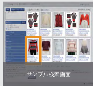
サンプル検索画面