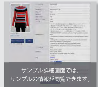
サンプル詳細画面では、サンプルの情報が閲覧できます。